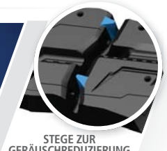
STEGE ZUR GERÄUSCHREDUZIERUNG