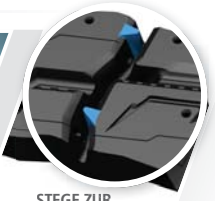
STEGE ZUR GERÄUSCHREDUZIERUNG